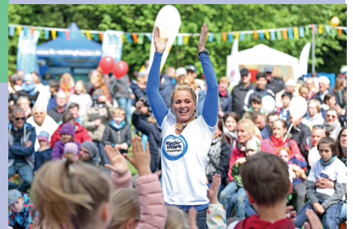
Singa Gägens ist Moderatorin beim Kinderkanal KiKA und Botschafterin der Mitmach-Initiative „Kinder stark machen“

Im Infozelt können sich Eltern, Trainerinnen und Trainer aus Sportvereinen sowie Lehrkräfte Tipps und Ratschläge holen, wie man im Alltag Kinder für ein suchtfreies Leben stärken kann. Für alle großen und kleinen Festbesucher werde ich Autogrammwünsche erfüllen.